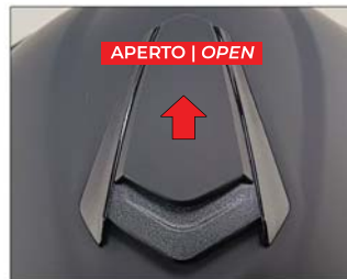
APERTO | OPEN