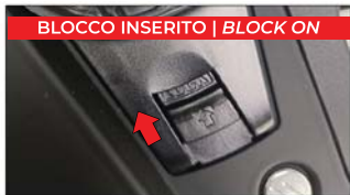
BLOCCO INSERITO | BLOCK ON