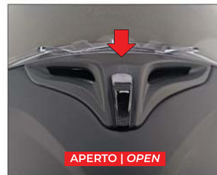
APERTO | OPEN