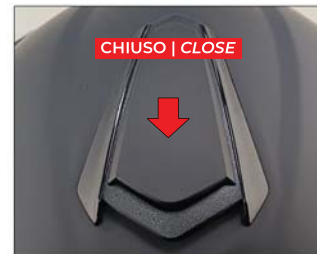
CHIUSO | CLOSE